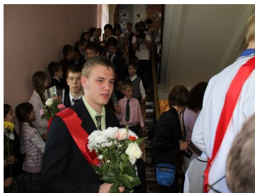
Материал подготовлен выпускником Антоном Куракиным