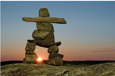
Инукшук— символ олимпийских игр в Ванкувере

Коренное население Канады составляют несколько племён аборигенов. Одно из них, инуиты. Инуиты бережно хранят традиции своих предков, что не мешает им идти в ногу со временем. Например, они продолжают пе-