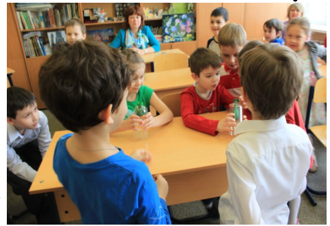
ники внимательно следили за работой малышей, подсказывали, как