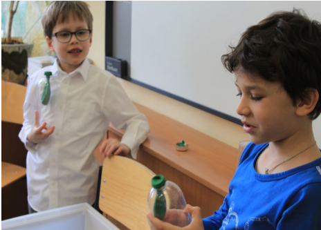
Занятия с первоклассниками были посвящены доказательству того,

Больше года в школе работает кружок для учеников младших классов «Воздух - это ничто?». Ребята проводят интересные опыты, объясняют их, учатся работать с различными источниками информации, что способствует формированию исследовательского стиля мышления.